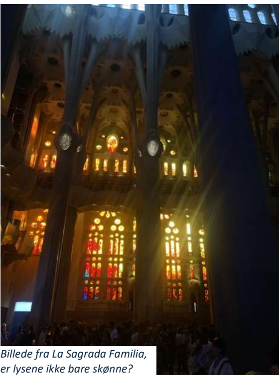
Billede fra La Sagrada Familia, er lysene ikke bare skønne?

Selvom den ydre arkitektur var skøn, var den indre i sandhed flot. De farvede vinduer gav solen plads til virkelig at skinne. Jeg ville ønske jeg kunne få de slags vinduer i mit hus. I hele vores rundvisning var jeg målløs. Jeg fik også en vis taknemmelighed over-