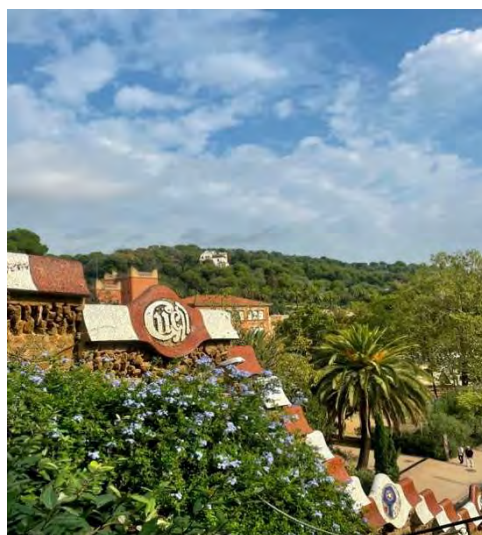
Dette billede er taget af Park Güell flotte natur.

Park Güell: Vi besøgte Park Güell første dag vi var der, og lad mig bare sige, hvor mindeværdig denne oplevelse har været. Vi ankom kl. 11:00, men allerede der var der rimelig mange turister, der var inde i parken. Selvom jeg ikke lagde mærke til, at der var så mange mennesker, da parken er så stor, ville jeg anbefale at komme tidligt. Vi gik en lang tur i den vidunderlige park, hvor der var utrolig natur med en masse planter, træer, blomster og stier. Parken skildrer fra bydelen af Barcelona, da man er langt væk fra byens støj. Parken ligger på en bakke og byder på en uforglemmelig udsigt over Barcelona og Middelhavet.