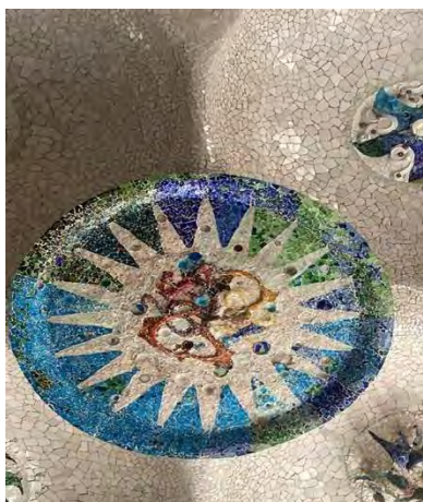
Dette billede er også taget inde i Park Güell, og er en af Gaudís mange mosaikskulpturer.

I parken var der detaljeret bygget af selveste Gaudí. Vidste i godt, at parken blev bygget mellem årene 1900-1914. Det er en meget inspirerende oplevelse at se de skæve bygninger og skulpturer i flotte og farverige farver. Gaudí forstod virkelig at skabe noget unikt. Så hvis du elsker natur og er interesseret i detaljeret kunst, så skal du besøge Park Güell. Jeg var i hvert fald meget tilfreds med denne oplevelse, da man fik tiden til bare gå og beundre parken og nyde den flotte natur.