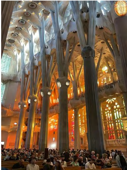
Dette billede er taget inde i kirken, og viser lys indfaldet og det unikke design af kirken.

La Sagrada Família: Næste destination, som jeg helt klart kan anbefale, er La Sagrada Família. Det var en rigtig idylsk bygning, hvor man rigtigt kunne mærke naturens skabning i selveste kirken. Selve kirken er enorm og arkitekten Gaudí har formået at skabe et helt unikt smukt og detaljeret univers, både inde og uden for kirken. Byggeriet af La Sagrada Família begyndte i 1882, og det er stadig under opførelse den dag i dag. Gaudí var inspireret af naturens forskellige former og strukturer. Man kan tydeligt se inde i kirken, at Gaudí var dybt fascineret af naturens geometri og organiske former. Der var brugt elementer som træer, planter, dyr og bjerge, hvilket jeg synes skabte en rigtig fin harmonisk integration mellem moderne arkitektur og naturens miljø. Man kan tydeligt se at Gaudí var inspireret af lys, da der inde i kirken er designet store, farvede